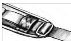
Fig. 1 - Stroppen statisk