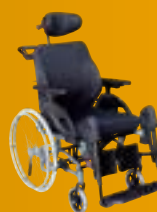
Netti 4U CED