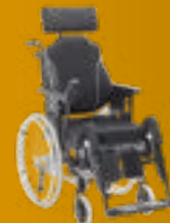
Netti III EL