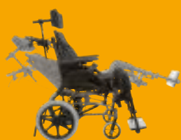
Netti Dynamic CED

Kørestole skal tilpasses til brugeren og ikke omvendt. Derfor møder vi nogle gange brugere med udfordringer, som ikke kan løses af standardudstyr. Her vil vores team af erfarne medarbejdere skabe det tilbehør eller den stol, som opfylder de konkrete behov.