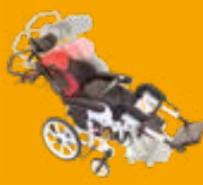
Netti Dynamic S