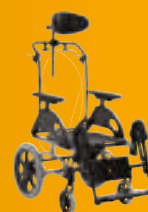
Netti 4U Base