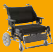
Netti 450 T