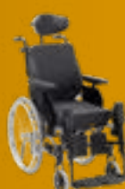
Netti 4U CE Plus