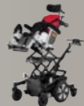
iCHAIR Netti Dynamic S