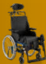
NETTI 4U CE

Se flere detaljer på side 24-29 og meyragroup.dk