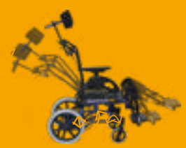
Netti Dynamic Base