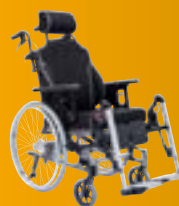
Netti III HD